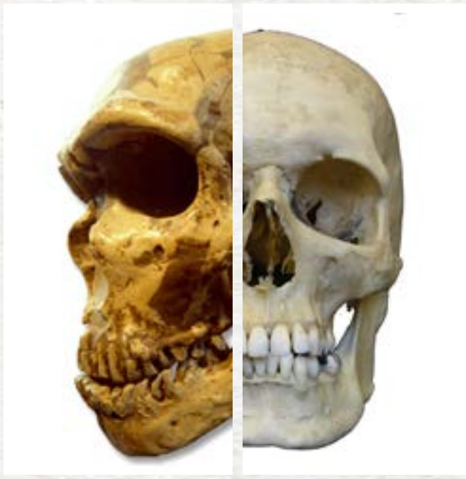
Crâne de Neandertal ( Homo neandertalensis )

A-t-il existé, par le passé, plusieurs humanités ?