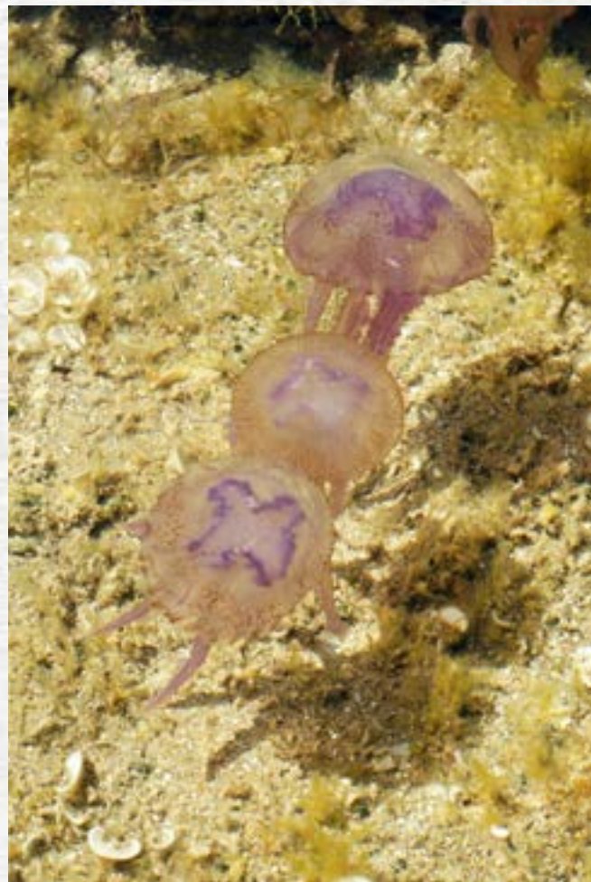
Pelagia noctiluca

Depuis une trentaine d'années les peuplements des océans changent. Peu à peu les méduses sont devenues plus abondantes, perturbant la vie dans les mers. Les mécanismes qui permettent ces pullulations sont d'abord liés au milieu lui-même : changement climatique, acidification et surpêche. Mais les méduses possèdent des possibilités d'adaptation dans leur cycle de vie qui assurent leur prolifération.